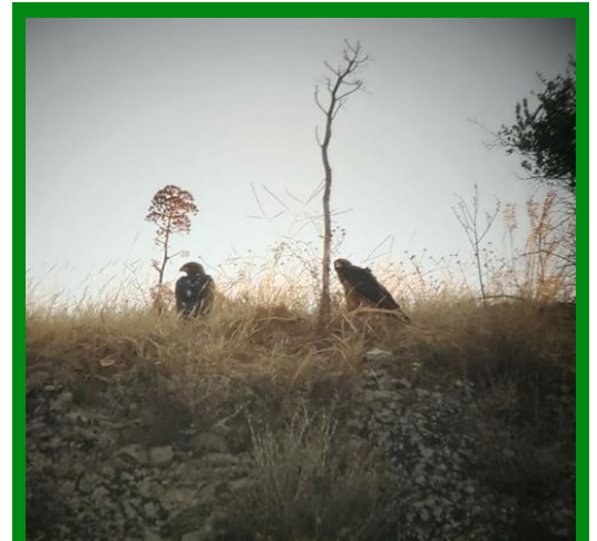
Il momento di massima soddisfazione è quando, dopo settimane di appostamento al campo di sorveglianza, i giovani finalmente, si involano. In basso, un'aquila ritratta da una fototrappola